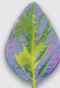
Absorção e translocação